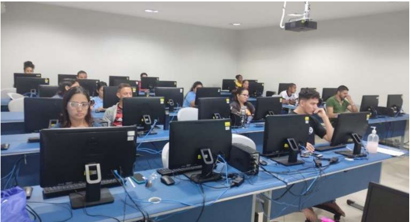
Avaliação de Desempenho de Estudantes do SENAI

Referência para o Brasil, o desempenho do SENAI/RR é reconhecido quando o assunto é conhecimento e ensino técnico profissionalizante.