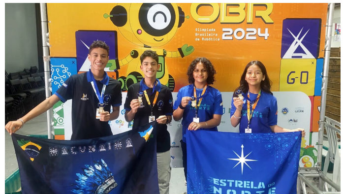
Estudantes de robótica das equipes Macunaíma e Estrela do Norte, premiadas na Olimpíada Brasileira de Robótica, realizada em Goiânia-GO.

First Lego League (FLL) – é um programa internacional sem fins lucrativos, operacionalizado no Brasil, desde a temporada 2012-2013, pelo Departamento Nacional do SESI. A ação foi criada por instituições dos Estados Unidos para incentivar a ciência e a tecnologia entre as crianças e jovens.