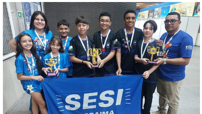
Equipes de robótica da Escola Sesi-RR, premiadas no Torneio Regional de Robótica First Lego League (FLL), realizado em Manaus - AM.