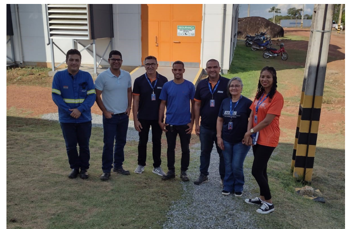
Registro fotográfico da visita técnica do setor de mercado do SENAI a empresa Radical Moto Peças e serviços