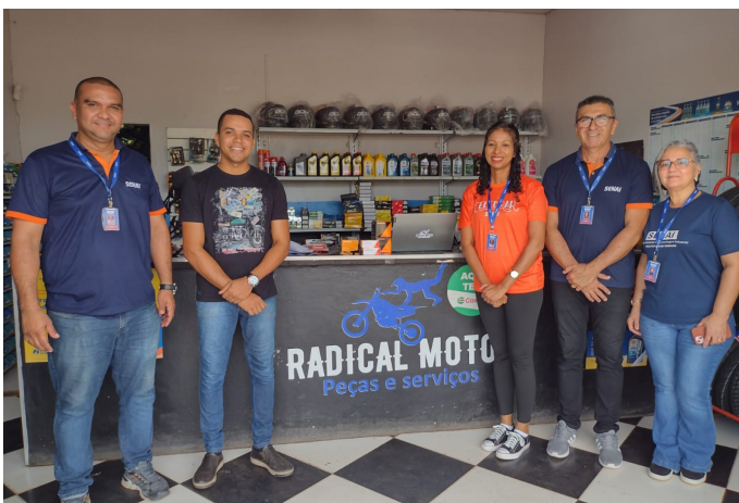
Registro fotográfico da visita técnica do setor de mercado do SENAI a empresa Radical Moto Peças e serviços

A iniciativa reforça o compromisso das equipes de Mercado e Educação do SENAI/RR com o desenvolvimento local, por meio da formação de mão de obra qualificada, atendendo às especificidades de cada região.