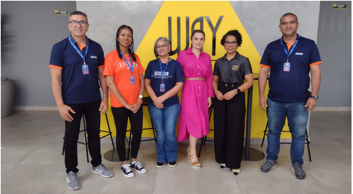
Registro fotográfico da visita técnica ao Way Hotel

A equipe de Mercado e Educação do SENAI/RR realizou, recentemente, uma série de visitas técnicas a empresas do município de Rorainópolis, com o objetivo de conhecer de perto as demandas do setor produtivo local e identificar estratégias para promover a qualificação profissional alinhada às necessidades da região.