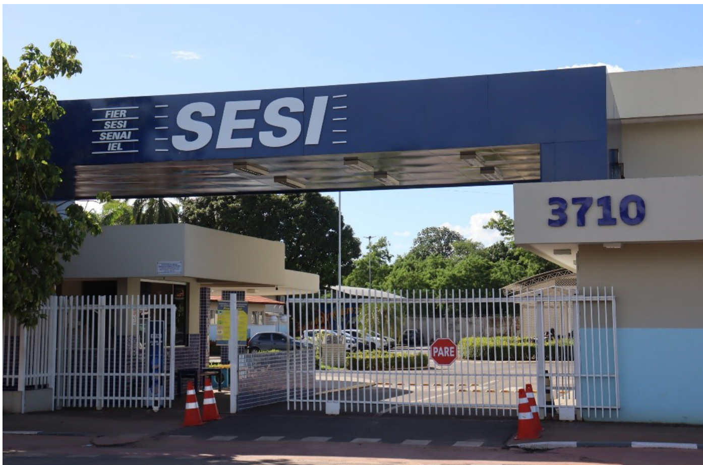
Edição do Saúde de Rua ocorrerá na sede do Sesi, no bairro Aeroporto

Iniciativa que ocorre neste sábado disponibilizará mais de 30 serviços gratuitos à população entre consultas médicas, serviços jurídicos e outros