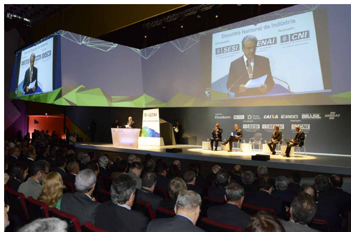
Comitiva da FIER participa da 9ª edição do ENAI

Todos os temas apresentados, desde as ações neces-