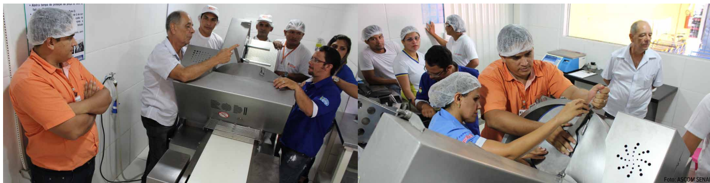
SENAI Roraima executa serviços de NR12 para empresas da área de alimentos

Por meio da vertente de Serviços Técnicos e Tecnológicos – STT o SENAI/RR realizou o curso de NR12, que se refere a segurança no trabalho em Máquinas e Equipamentos, para 12 colaboradores das empresas Frios Rio Branco e Supermercado Goiana.