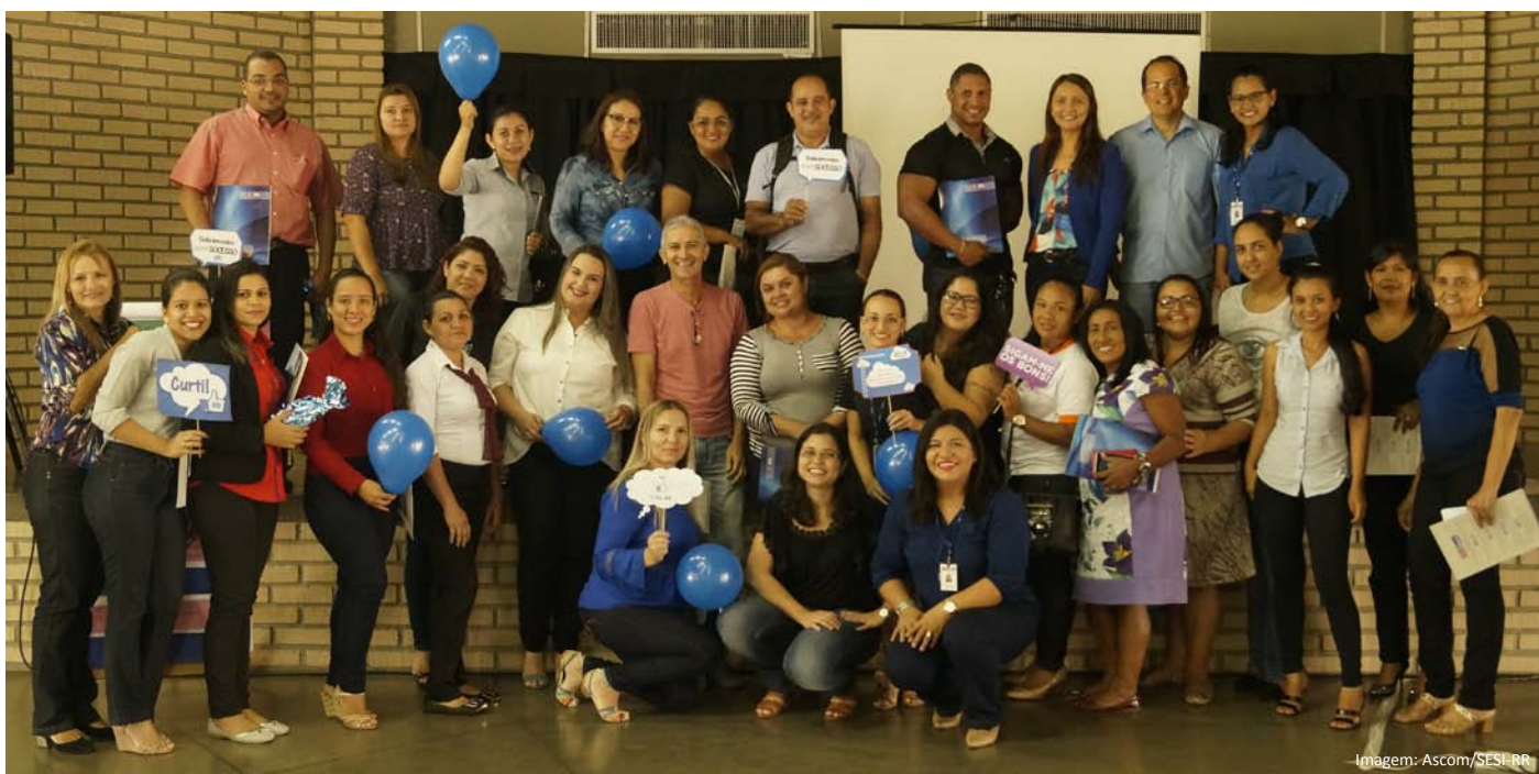
Equipe do IEL junto com Supervisores de Estágio.