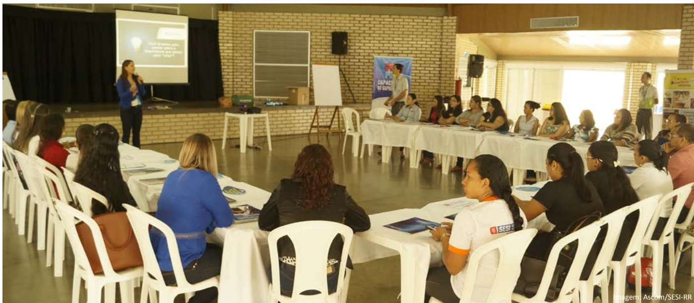
O Foco da capacitação foi criatividade e inovação.

O Instituto Euvaldo Lodi - IEL/RR realizou na quinta-feira (28) de abril, um Workshop com 30 Supervisores de Estágio de diversas instituições e empresas do Estado que participam do programa oferecido pelo Instituto.