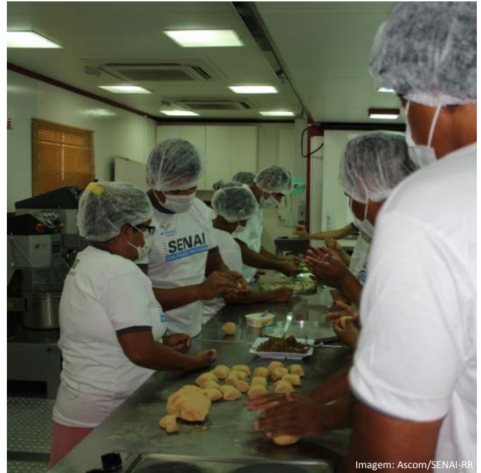
Interior da Unidade Móvel de Alimentos que está no Município de Bonfim.

Para o segundo semestre, novas turmas estão sendo abertas, para garantir a continuidade da qualificação de mão de obra no interior do Estado. Os trabalhadores certificados são aproveitados pelas administrações públicas e mais facilmente pela iniciativa privada, pois a educação profissional é um diferencial na vida de qualquer trabalhador.