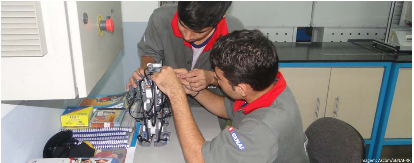
Alunos no laboratório do SENAI.

O SENAI Roraima abriu novamente inscrições para o curso de Introdução a Robótica, na modalidade de iniciação profissional, com a proposta de proporcionar ao estudante habilidades e técnicas para desenvolver aplicações em robôs industriais. A turma está prevista para iniciar ainda no mês de maio, com carga horária de 40 horas, período em que serão ministradas fundamentações teóricas e práticas sobre robótica, manipulação e programação de robôs.