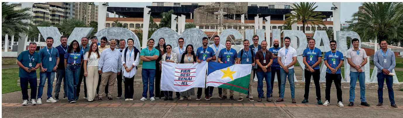
Comitiva formada por 30 empresários esteve em Puerto Ordaz para rodadas de negócios, visitas técnicas e exploração logística, marcando a retomada da integração econômica na fronteira.

A Federação das Indústrias do Estado de Roraima (FIER) e a Câmara Venezuelana Brasileira de Comércio e Indústria de Roraima realizaram, entre os dias 15 e 18 de junho, a Missão Empresarial Venezuela 2026. Durante o período, uma delegação de 30 empresários roraimenses cumpriu uma intensa agenda em Puerto Ordaz, no Estado Bolívar, consolidando uma das mais relevantes ações de prospecção comercial entre as duas regiões na última década.