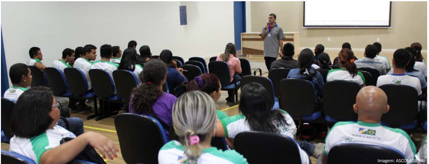
Alunos durante o lançamento do Caderno Caminhos.

Vem aí o "Inova moda – Inverno 2016", o terceiro ciclo da ação que dá continuidade ao Projeto Nacional de Moda, marcado pelo lançamento do Caderno "Caminhos". O projeto é uma iniciativa do SENAI Cetiqt (Centro de Tecnologia da Indústria Química e Têxtil) e Sebrae.