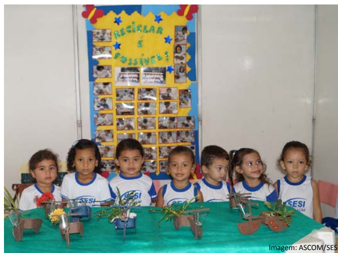
Alunos do maternal durante a Indústria de Talento 2014.

A exposição é aberta para os pais e a comunidade em geral. Durante o evento os estudantes irão comercializar os seus produtos, o dinheiro