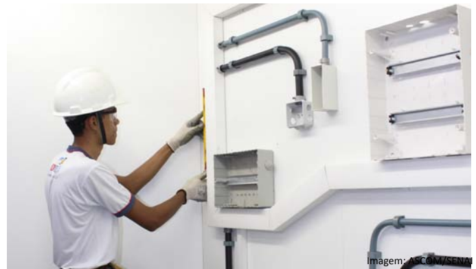
Podem participar jovens com idades entre 14 a 23 anos.

As aulas serão ministradas pela manhã ou tarde, dependendo do curso escolhido, e terão carga horária que varia de 1.040h a 1.240 horas. As aulas, de todos os cursos, terão início em 15 de julho deste ano.