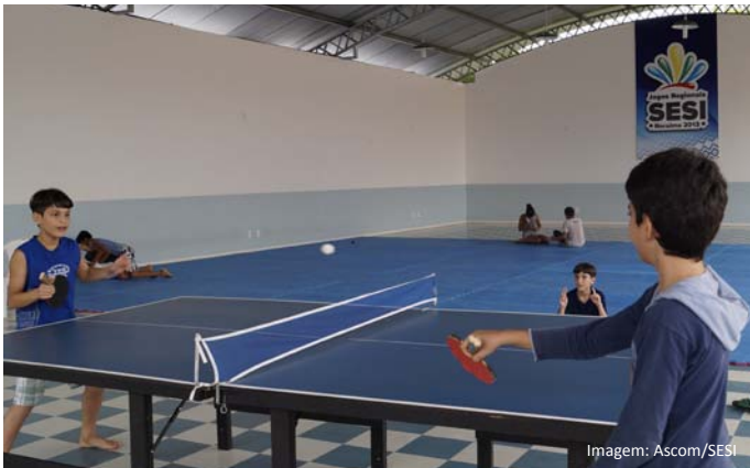
Alunos brincando de Tênis de Mesa