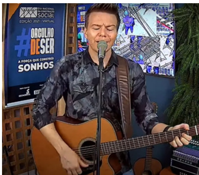
Cantor Michel Teló trouxe sucessos do sertanejo para animar o evento

Desde sua criação em 2007, o DNCS acumula 4.256.956 de atendimentos, tendo alcançado 882.338 pessoas. Robustos, os números sinalizam o grande potencial de ações voltadas ao trabalhador da construção e seus familiares, reforçando a necessidade de iniciativas perenes de responsabilidade social voltadas a esse público.