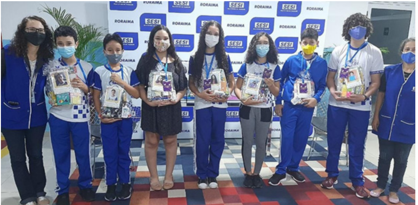
Alunos receberam medalhas e ganharam prêmios na primeira edição do concurso de poesia

A Escola do SESI premiou os alunos vencedores da primeira edição do Concurso de Poesia chamado “Onde as palavras se encontram”. A cerimônia ocorreu na tarde do dia 20 de agosto no hall do auditório do Centro de Educação do Trabalhador João de Mendonça Furtado - CET/RR.