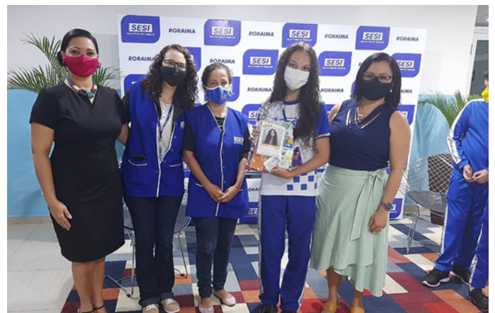
1º lugar na categoria Natureza e Saude