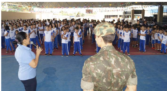
Cívico na quadra do CET/SESI