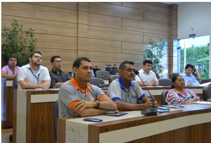
Membros do CTMAR durante apresentação da Eternal

Os membros do Conselho Temático de Meio Ambiente, Recursos Naturais, Energia e Infraestrutura – CTMAR, reuniram-se no dia 01 de setembro para a 4ª reunião ordinária de 2016, no auditório da Federação das Indústrias do Estado de Roraima – FIER.