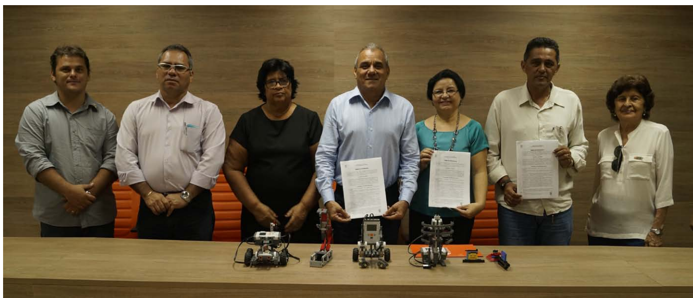
Instituições assinaram termo de cooperação sobre Programa de Robótica Educacional