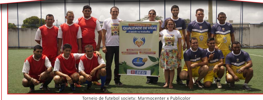
Torneio de futebol society: Marmocenter x Publicolor

Na manhã do dia 10 de setembro o SESI foi parceiro da Publicolor Comunicação Visual na realização do encerramento da 1ª Semana da Qualidade de Vida e Saúde no Trabalho, realizada pela empresa. A programação aconteceu no Centro de Atividade do Trabalhador Waldir Peccini- SESI/RR.