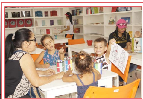
Recreação na Indústria do Conhecimento