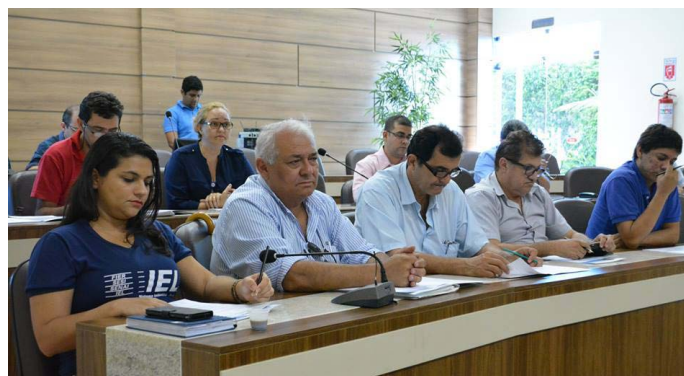
Membros do COMPI durante a reunião

A 4ª reunião ordinária do Conselho Temático de Micro e Pequena Empresa, Economia e Política Industrial - COMPI, realizada no dia 6 de setembro, no auditório da Federação das Indústrias do Estado de Roraima - FIER, foi aberta com as boas vindas da presi-