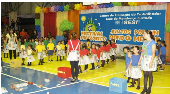
Alunos inovaram em suas apresentações com figurinos "sustentáveis"