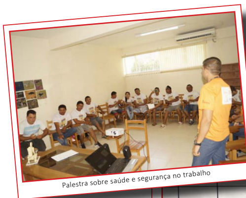
Palestra sobre saúde e segurança no trabalho