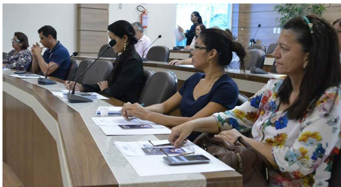
Membros do Conselho pretendem disseminar o assunto aos demais empresários

Os membros do Conselho Temático de Responsabilidade Social e Relações Trabalhistas – CTRSRT se reuniram na terça-feira, dia 6 de setembro, no auditório da Federação das Indústrias do Estado de Roraima - FIER, para tratarem de assuntos pertinentes da 4ª reunião ordinária.