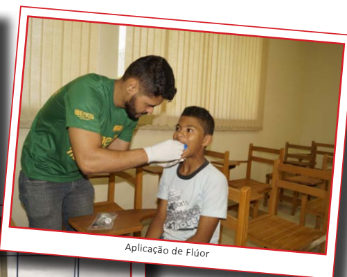
Aplicação de Flúor