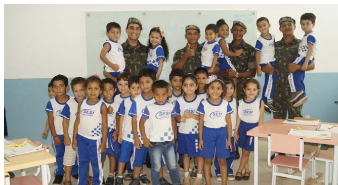
Exército durante visita na Educação Infantil

No dia 7 de setembro é comemorado o Dia da Independência do Brasil, que foi proclamada por D. Pedro I, em 1822. Uma data tão importante para nosso País não poderia passar despercebida pelos alunos do Centro de Educação do Trabalhador João Mendonça Furtado – CET/SESI-RR, que participaram de uma programação diferente no dia 05.