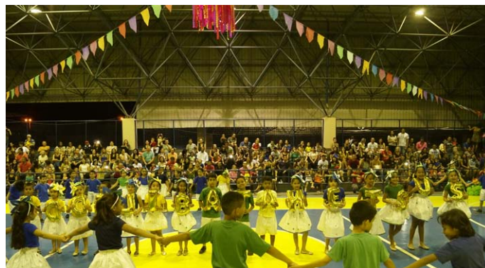
Evento reuniu 900 pessoas

O tradicional Festival Folclórico, um dos maiores eventos culturais, realizado pelo Centro de Educação do Trabalhador João de Mendonça Furtado – CET/SESI aconteceu no dia 03 de setembro, e contou com um público estimado em 900 pessoas entre alunos, familiares e gestores da escola.